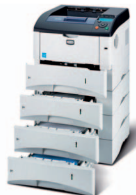
Abbildung enthält Optionen.