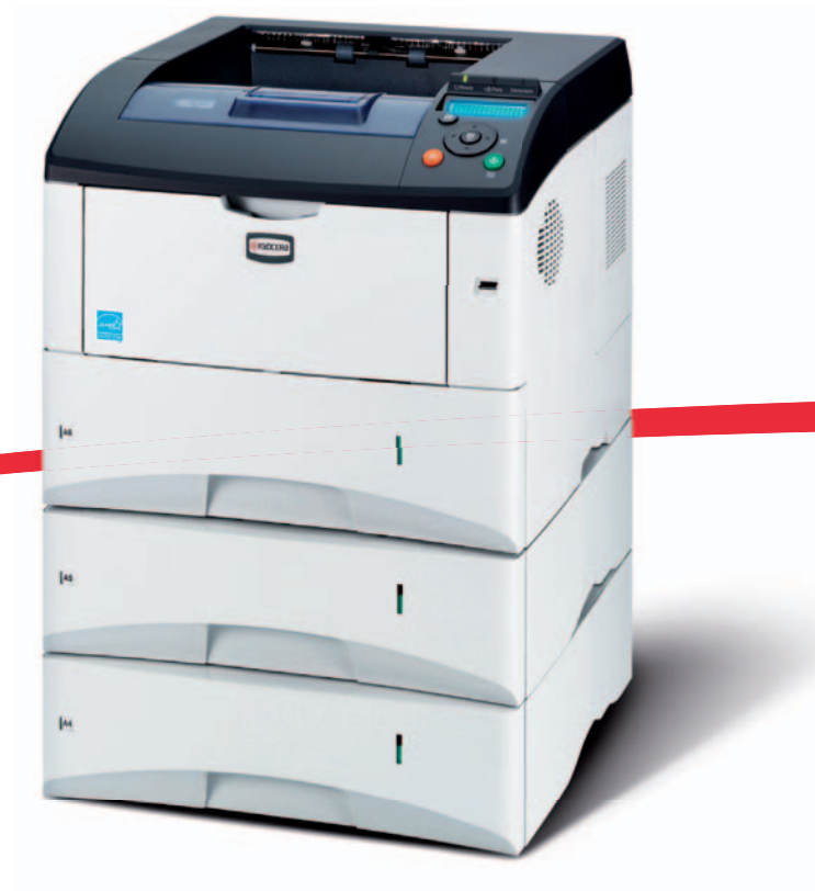
Abbildung enthält Optionen.