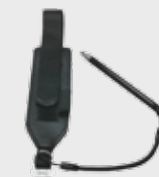
▪ 94ACC0133 Handschlaufe (im Lieferumfang dabei)