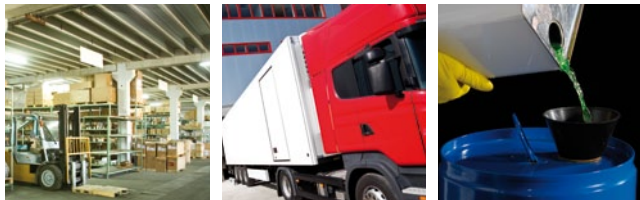
* Wettbewerbsvergleich B-EX4T2 im Stand-by Mode.

Der B-EX4T2 ist erhältlich als 203/300 oder 600 dpi Variante und bietet damit für Spezialisten höchste Druckauflösung und beste Druckqualität.