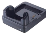
Lade- und Kommunikationsstation