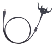
USB snap-on Anschlusskabel